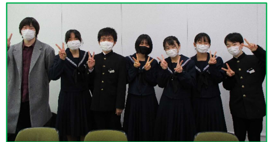
ステレオリムーブ課の学生と、 長久手中学校生徒会執行部の皆様