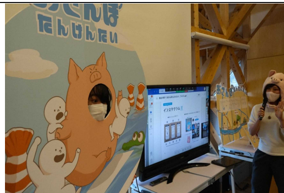
町づくりデザイン公開授業