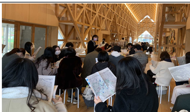
長久手まち歩きマップ作成ワークショップ