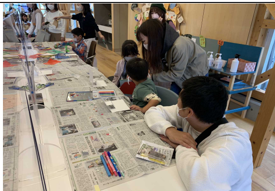
長久手子ども食堂

ついてディスカッションを実施した。 愛知県立大学「長久手まち歩きマップ作成ワークショップ」 令和4年3月6日（日）午後0時30分から4時30分まで 長久手市の昔と今の地図を見比べながら長久手市の歴史に関わる講演を 講師の方よりいただき、その地図をもとにまち歩きを行った。