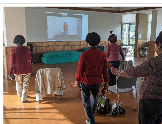
鳴子を使った運動（オンライン）①