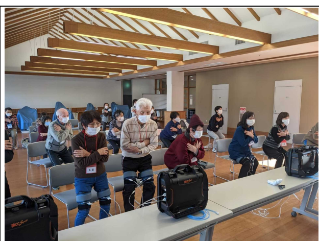
虚血状態と解放を90秒繰り返す