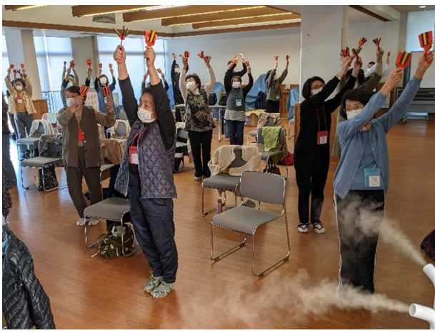
鳴子を使った運動（オンライン）②