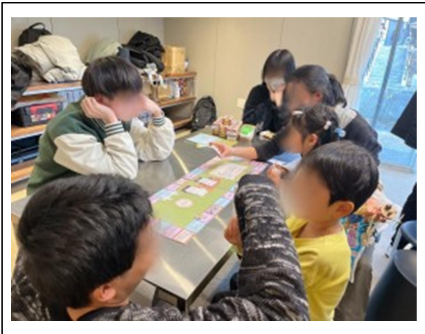
(内容) まざって長久手フェスタにおいて地域の子どもたちが完成品を体験する様子