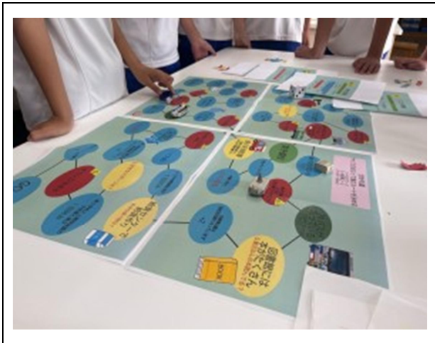
(内容) 長久手市立南中学校文化部の生徒が試作品の体験及び助言を行う様子