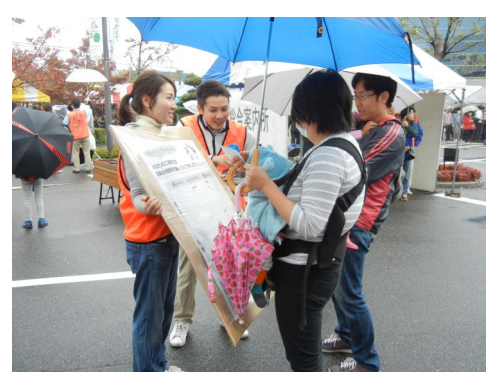
(写真中、右) 当日の様子