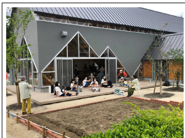
「リリモテラス公益施設」において、指定管理者及びリリモテラス運営協議会が連携して実施した企画に参加する市民の様子。