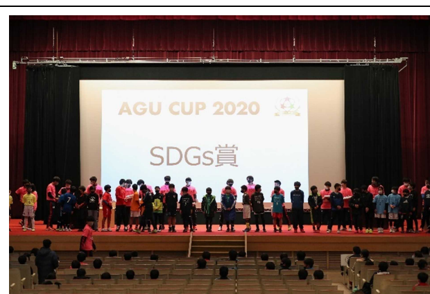
各チーム2名 SDGs 賞を授与