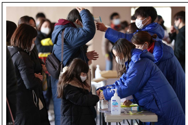
受付にて検温と消毒