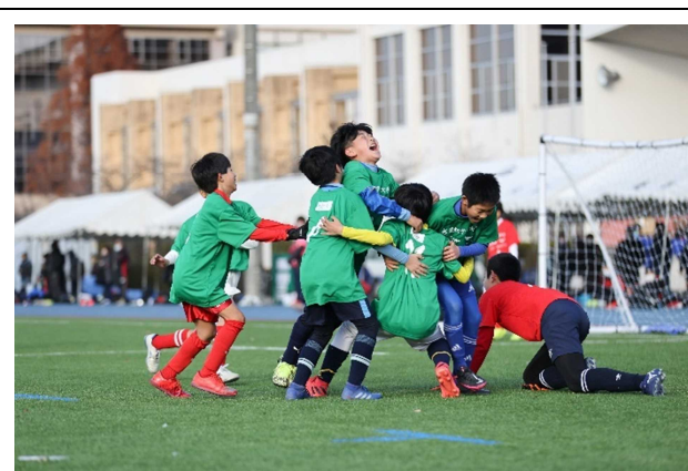
所属クラブではなく、混合チームでプレー