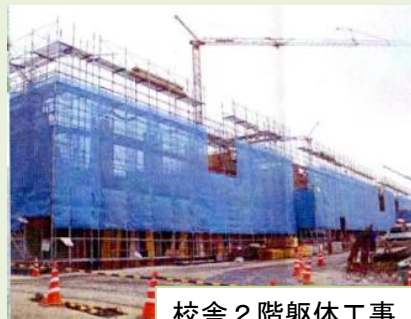
校舎 2 階躯体工事

躯体工事が進行しています。3 月中旬には 1 階のコンクリートを打設し 4 月は 2 階、5 月は 3 階のコンクリートを打設する予定です。順調に進みますと、最上階の 4 階は 6 月にコンクリートを打設予定です。