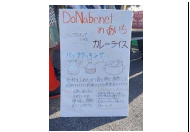
パッククッキングについて説明するパネル