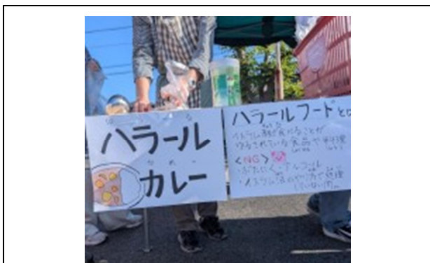
ハラール食についての説明