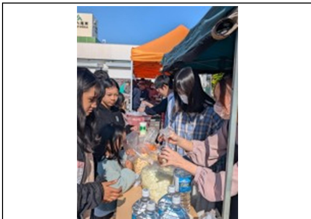
住民とパッククッキングを行う様子