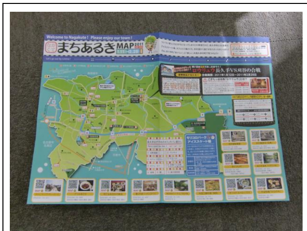
「まちあるきマップ (表面)」