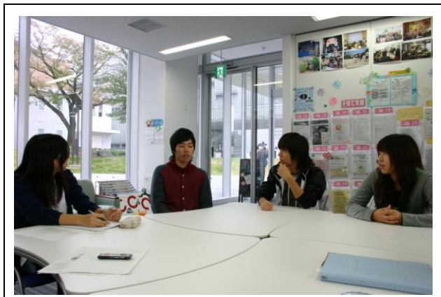
愛知淑徳大学CCC内で行ったインタビューの様子