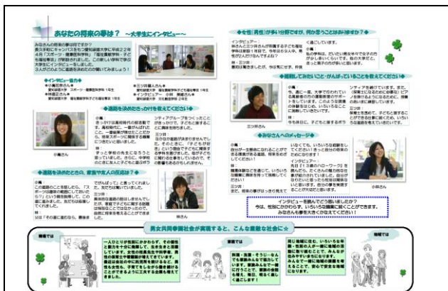
中学生向け男女共同参画啓発用情報紙