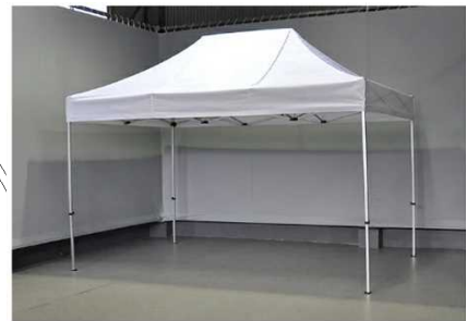
ブース出店用 2セット サイズ:2.4m×2.4m