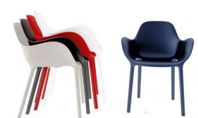
スタッキングチェア 20脚