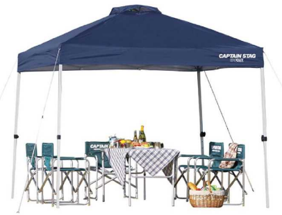
タープテント 1セット サイズ:2.0m×2.0m