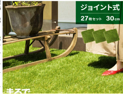
ジョイント式人工芝2.4㎡ 8セット