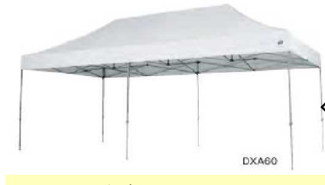
ステージバックヤード用 1セット サイズ:3m×6m