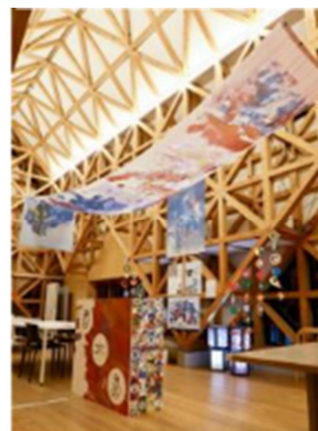
(内容) 展示会の様子