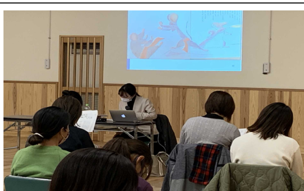
映像を見ながらごっこ遊びについて学ぶ