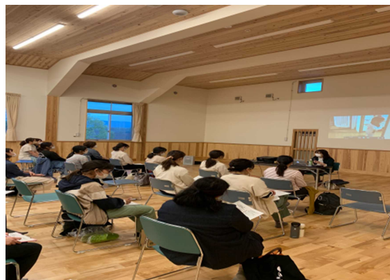
幼児の発達とごっこ遊びについて