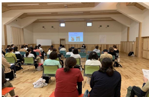
乳児の発達とごっこあそびについて