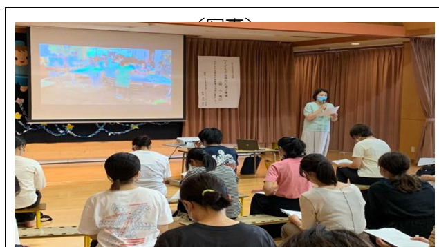
映像を見ながら自発的に遊ぶ環境を学ぶ