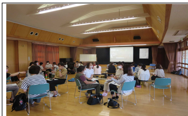
環境作りについて各園と情報共有