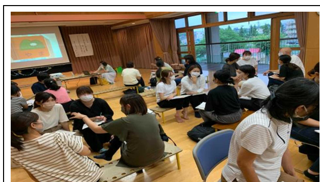
手作り玩具について情報交換