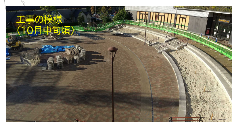
パーゴラ(屋根掛け施設)の基礎を作っています