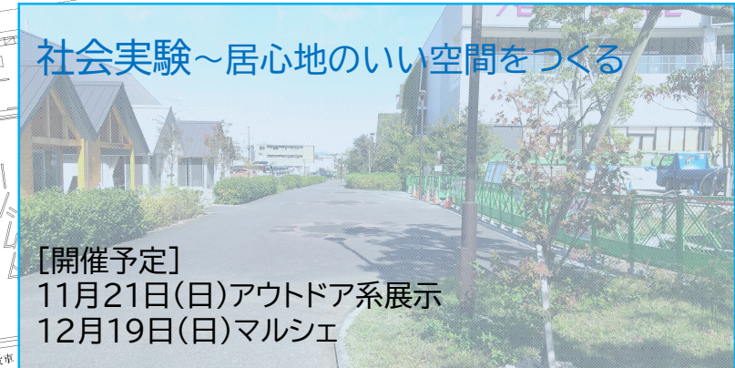
社会実験~居心地のいい空間をつくる