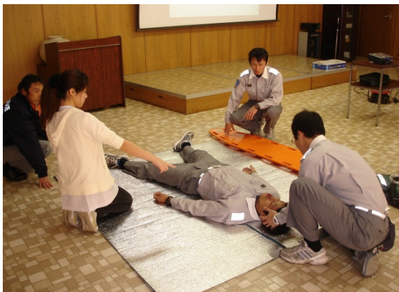
待機中の訓練風景