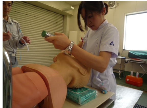
待機中の訓練風景