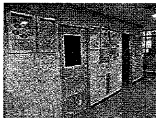
《パネル展示の様子》