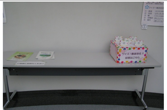
「長久手のあの地名あの頃」のパネルのクイズ回 答