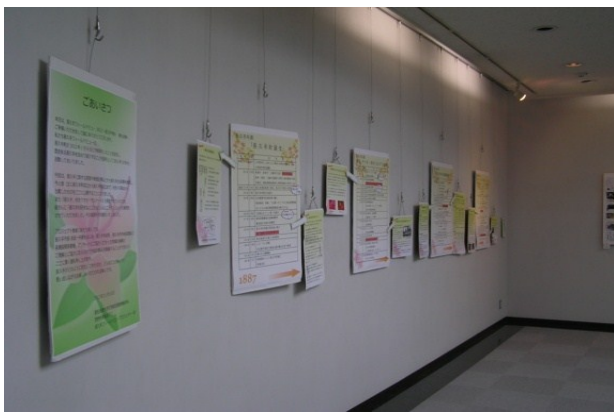
中央図書館展示会場の様子