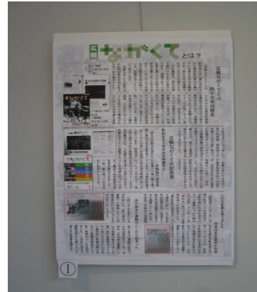
「広報ながくてとは?」のパネル