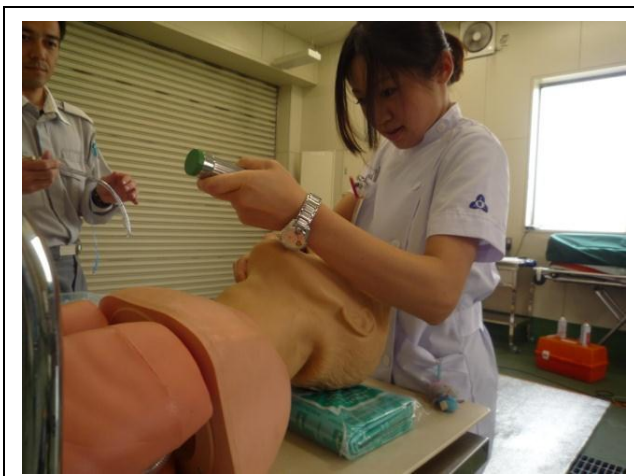
待機中の訓練風景