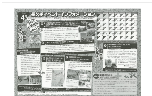
「まちあるきマップ」(表面)