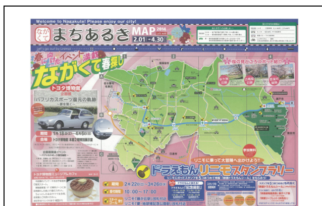
「まちあるきマップ」(表面)