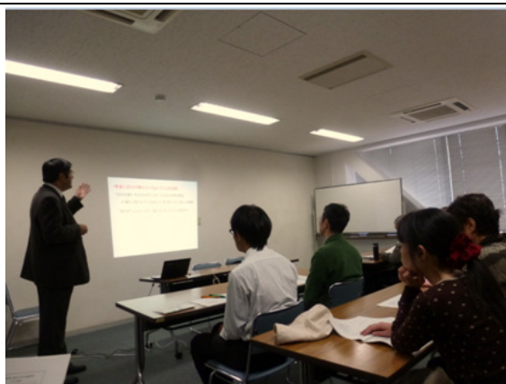
「げんきなところ」を作るため「睡眠」、「照明」、「食」の必要性を学んでいる様子