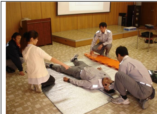
出動待機中の訓練風景