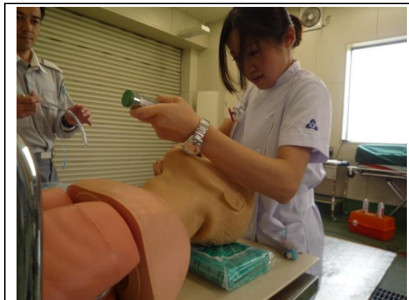
喉頭展開訓練風景