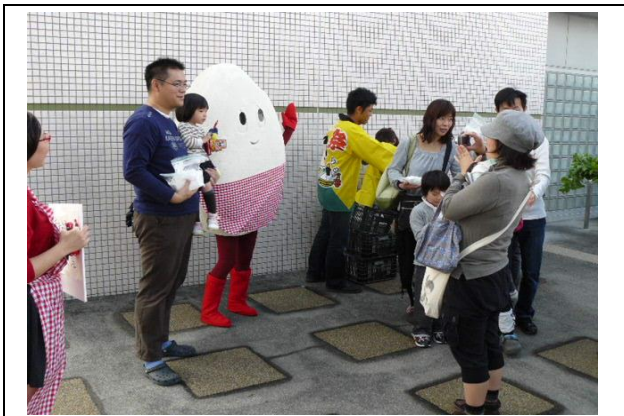
キャラクターの着ぐるみを試験的に着用した米粉普及活動（農業展）。