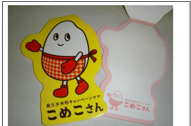
キャラクターを活用したメモ帳を制作。