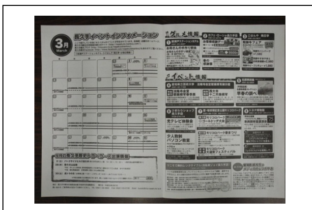
「まちあるきマップ」の裏面は、毎月1回更新を行っている。