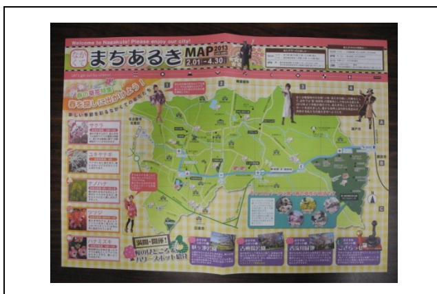
「まちあるきマップ」（表面）