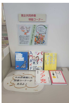
まちづくりセンター

テーマは「女性の働き方を考える」と「ワーク・ライフ・バランス」。多くの方に手にとっていただきました。