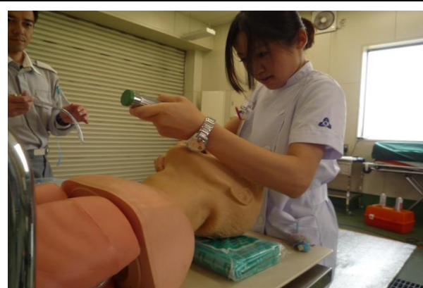
（内容）待機中の救急訓練