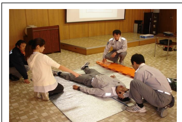
（内容）待機中の救急訓練