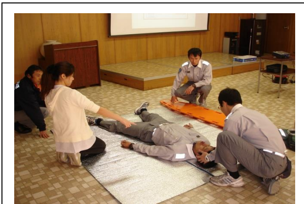
(内容) 待機中の救急訓練