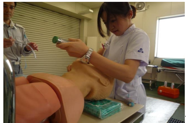
(内容) 待機中の救急訓練