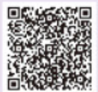
後期高齢者医療制度