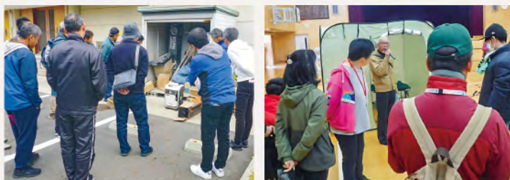
防災講演、防災倉庫の確認、資機材設営など、各地域でさまざまな訓練が実施されました。